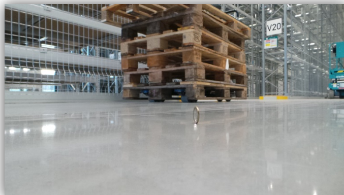
Endergebnis: Gereinigter Hartstoffboden mit C 2 WASH + C 2 HARD + 2x C 2 SEAL