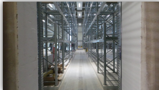
Vorher: Geglätteter Hartstoffboden, ca. 6 Wochen alt, deutliche Verschmutzung durch Montagearbeiten