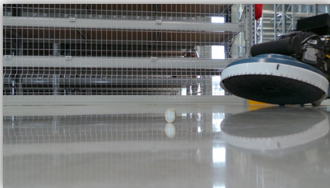
Nachher: Gereinigter Hartstoffboden mit C 2 WASH + C 2 HARD + 2x C 2 SEAL