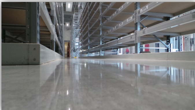
Endergebnis: Gereinigter Hartstoffboden mit C 2 WASH + C 2 HARD + 2x C 2 SEAL

C 5 - Oberflächenveredelungen von Condulith®