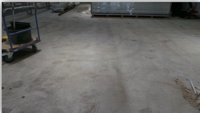
Vorher: Geglätteter Hartstoffboden, ca. 6 Wochen alt, deutliche Verschmutzung durch Montagearbeiten

C 5 - Oberflächenveredelungen von Condulith®