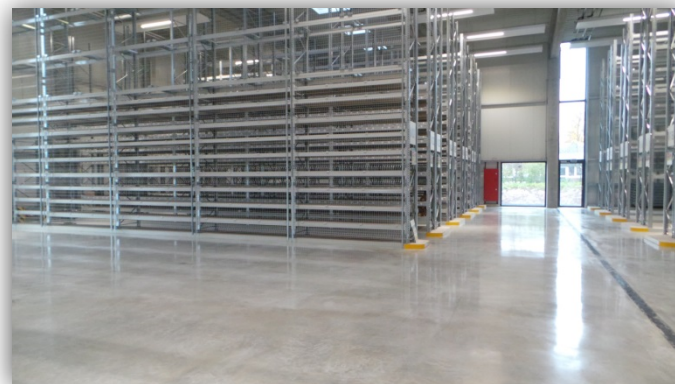
Nachher: Gereinigter Hartstoffboden mit C 2 WASH + C 2 HARD + 2x C 2 SEAL