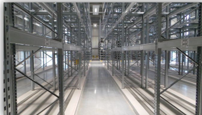
Nachher: Gereinigter Hartstoffboden mit C 2 WASH + C 2 HARD + 2x C 2 SEAL